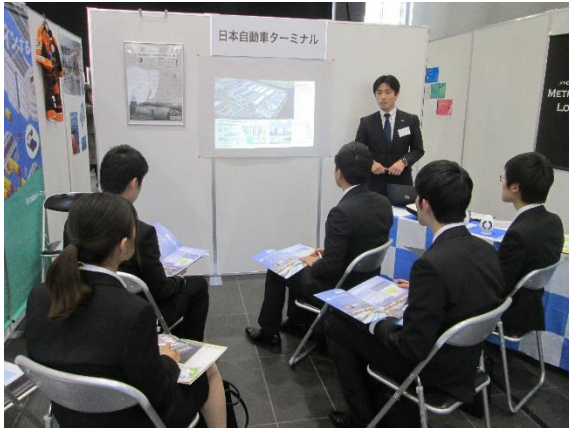
当社出展ブースの様子