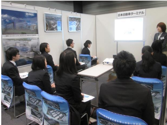
当社出展ブースの様子