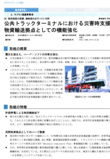
当社紹介ページ (p 70)

当社が取り組んでまいりました「災害に強いトラックターミナルの構築」が、内閣官房の『国土強靭化 民間の取組事例』に採択されました。